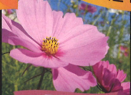
コスモス 10月初旬ごろ