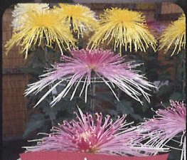
キク 11月上旬～中旬ごろ