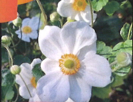
シュウメイギク 10月ごろ