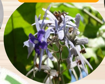
I ペトレア ウォルビリス