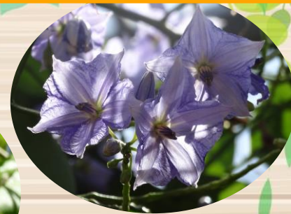
J ソラナム ウェンドランディー