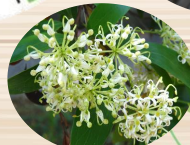
N ステノカルプス サリグヌス