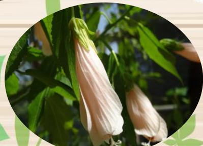
B ウナヅキヒメフヨウ