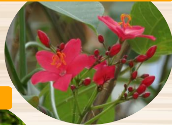
G ほこばヤトロファ